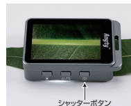
シャッターボタン

・DCIMAフォルダにPICA****.jpgという画像ファイルが、撮影することによって連番で生成されます。